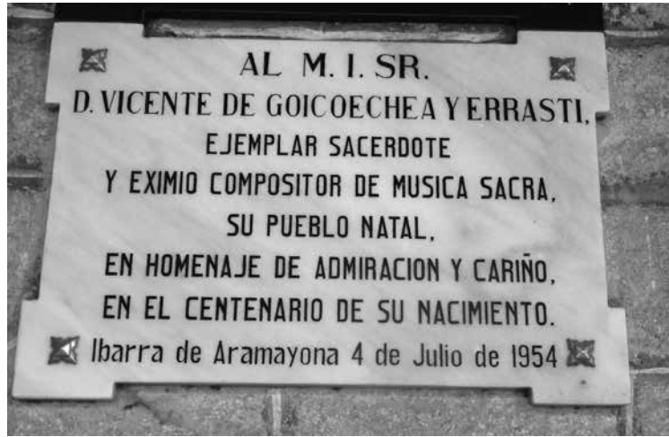
Parrokiaren atartean 1954an ipinitako plaka Placa colocada en el pórtico de la parroquia en 1954