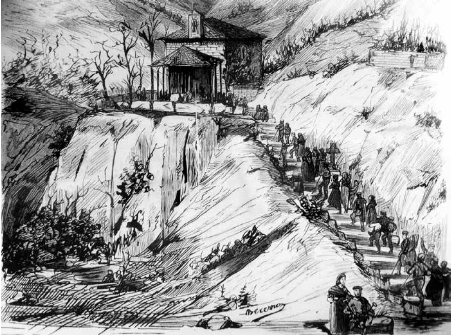
Karlistak Iabeko Andra Marira igotzen Los carlistas subiendo a Andra Mari de Iababe (Becerro de Bengoaren grabatua)

que estaba en su mano obtener el título de Notario. Luco optó por seguir con su Notaría y quedó vacante la plaza de Secretario.