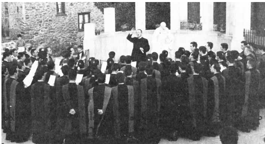
Gasteizko Apaiztegiko Schola Cantorum 1956an La Schola Cantorum del Seminario de Vitoria-Gasteiz, en 1956