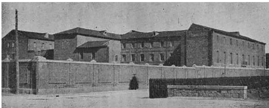
Valladolideko Apaiztegia XIX.ean Seminario de Valladolid, XIX