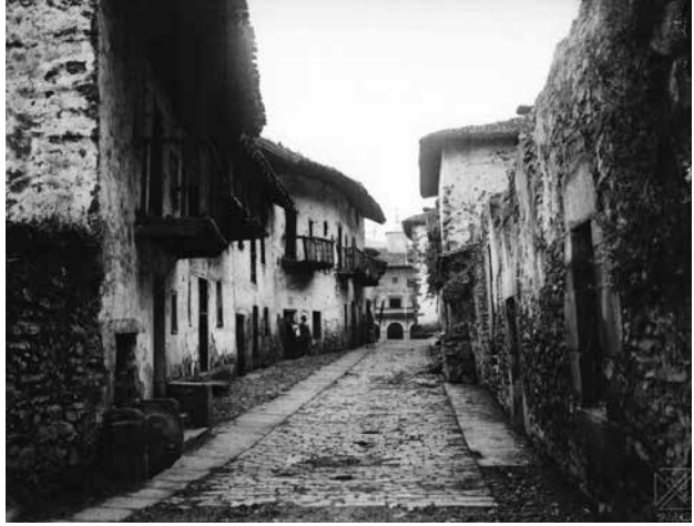
Matxain kalea Calle Matxain

Valladolid eta Espainiako kronikak heriotzaren berri eman zuten. Hona hemen Madrileko “La Acción” egunkariak zekarrena: